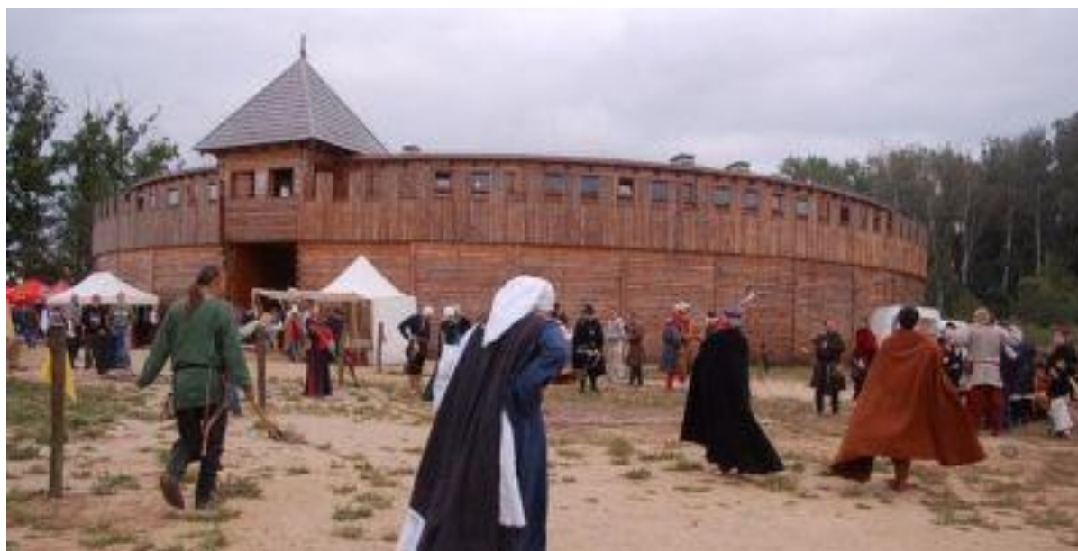
Replika Grodu średniowiecznego w Biskupicach w gminie Byczyna