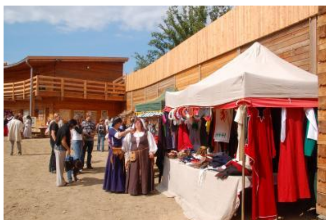
Stoisko z wyrobami rzemiosła średniowiecznego

Użytkowanie Grodu i organizowanie w nim różnorodnych imprez to część (choć niezwykle istotna) działalności spółdzielni. Prowadzi ona także sprzedaż balii szwedzkich dla miłośników gorących kąpiel, zajmuje się dystrybucją infrastruktury związanej z energią odnawialną jak kolektory