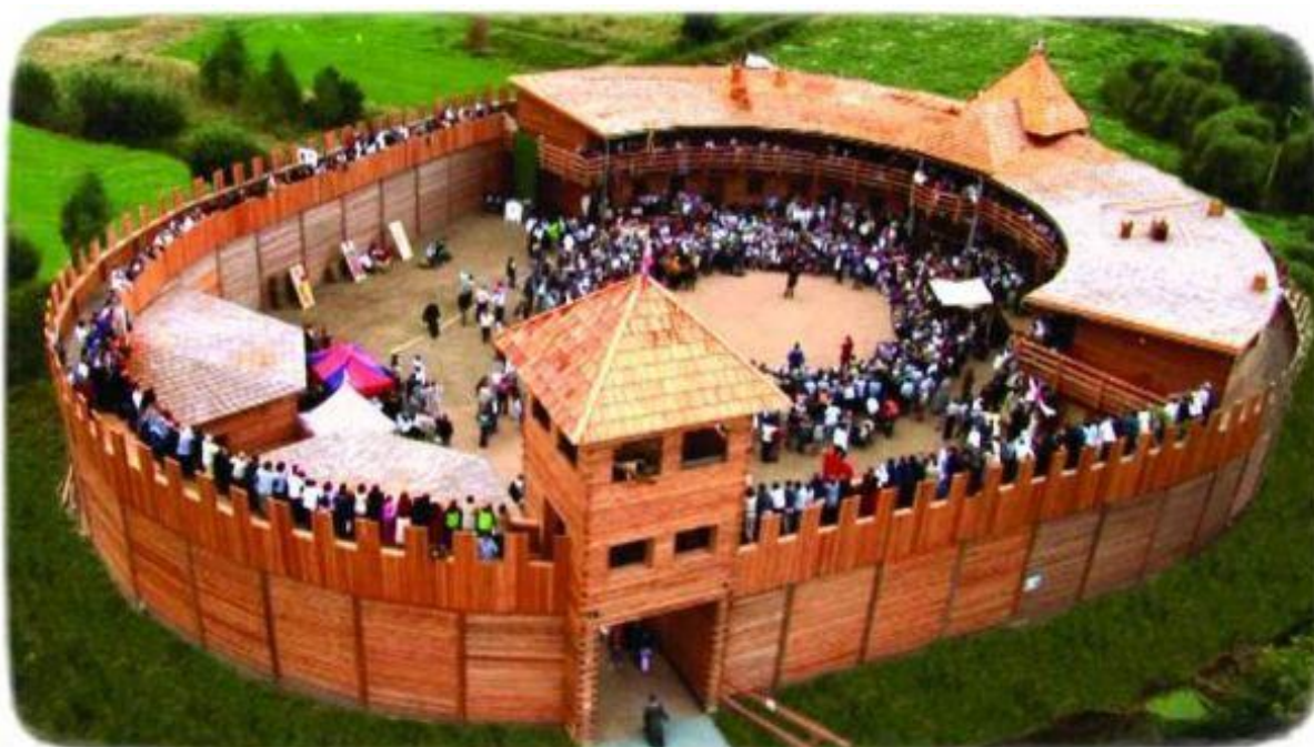
Widok Grodu średniowiecznego z lotu ptaka.

Opracowano w Obserwatorium Integracji Społecznej Regionalnego Ośrodka Polityki Społecznej w Opolu Opole, grudzień 2011