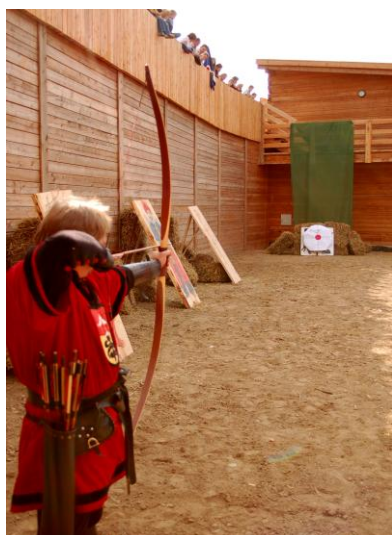
Pokaz strzelania z łuku

Spółdzielnia socjalna dzierżawi znajdującą się w grodzie karczmę oraz hotel, a także zajmuje się utrzymaniem obiektu. Partnerstwo z Opolskim Bractwem Rycerskim daje możliwość organizacji wielu imprez o charakterze rycerskim, spotkań integracyjnych oraz wycieczek i „zielonych szkół” dla dzieci. Ponadto w grodzie organizowane są m.in.: lekcje historii dla dzieci, szkolenia z zakresu fechtunku bronią średniowieczną, rzutów toporem, włócznią, nożem, nauka strzelania z łuku, jazdy konno, warsztaty rzemiosł średniowiecznych (kowalstwo, płatnerstwo, mincerstwo), pokazy strojów średniowiecznych. Dodatkowymi atrakcjami są pokazy rycerskie, inscenizacje bitew, pokazy katowskie, scen inkwizycji, koncerty zespołów muzyki dawnej. Obiekt czynny jest 24 godziny na dobę.